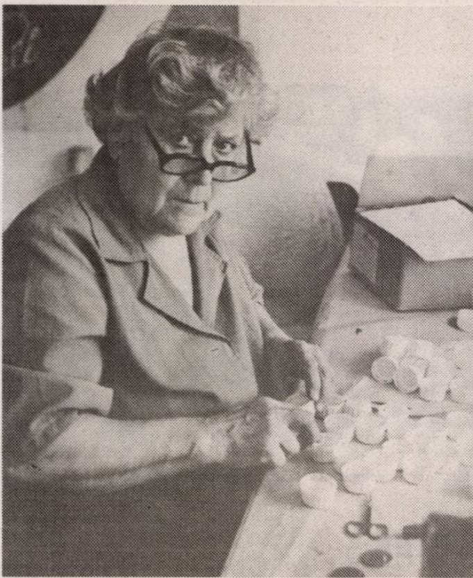
A Poligonban dolgozók egyelőre félnek, semmiféle garanciát nem kaptak még arra, hogy az átalakítás, majd eladás után is tovább dolgozhatnak.